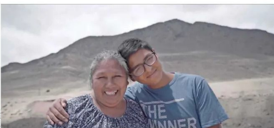
La más reciente iniciativa, actualmente en desarrollo, corresponde al Programa "Fireworks No More".

En ese entonces, con el apoyo de la Cancillería del Estado de Chile y sus consulados, y junto a Rotary Club de Santiago y diferentes clubes rotarios de Sudamérica, se inició el Programa "Rotaryquem".