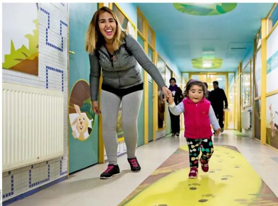
Para disponer de estos servicios cuentan con tres centros de rehabilitación en Santiago, Antofagasta y Puerto Montt, y presencia a lo largo de Chile a través de 21 oficinas regionales de coordinación.

equipamiento de última generación. Incluso, disponen de beneficios adicionales sin costo, en caso de que se requiera, como transporte, alojamiento y alimentación. También está el colegio hospitalario en Santiago, que pretende aportar en la continuidad escolar de los pacientes que están siendo rehabilitados. "Al cumplir 40 años deseamos que ningún niño que pueda requerir de nuestros servicios pierda esta oportunidad por desconocimiento de esta posibilidad de tratamiento. Por