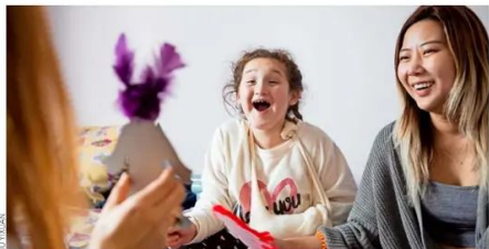
Esta iniciativa ayuda a la rehabilitación de niños y jóvenes que viven en lugares apartados de Santiago.

Integra aspectos como alojamiento, alimentación y escolarización a quienes acuden al Centro de Rehabilitación en Pudahuel.