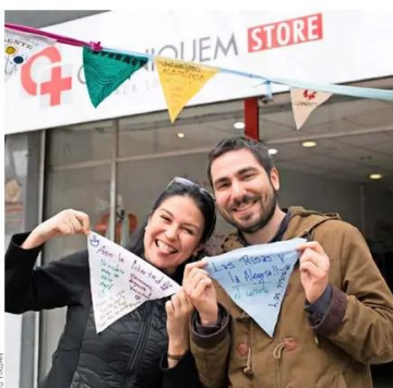
La institución ha apostado por proyectos que recauden fondos pero que, también, aseguren su mantención en el tiempo de manera sustentable.

Uno de los caminos a seguir es el de los nuevos desarrollos tecnológicos y el exponencial crecimiento en el acceso de las personas a internet y a los teléfonos inteligentes. Es así como la tecnología permite nuevos espacios de recaudación